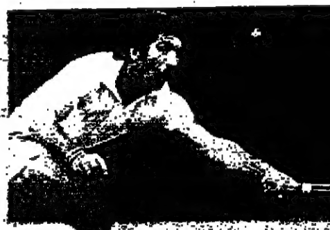
لقطة لاعب ماريونيل اورانيس (اسبانيا) أثناء مباراته مع شيرود سيوارت (الولايات المتحدة) - وتقدّم اورانيس (٦-٤، ٦-٢) -